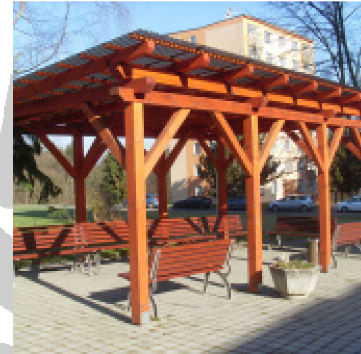
Pergola před Domovem

Nepříznivou sociální situací je stav, kdy osoba nemá možnost zajištění péče ve vlastním přirozeném prostředí.